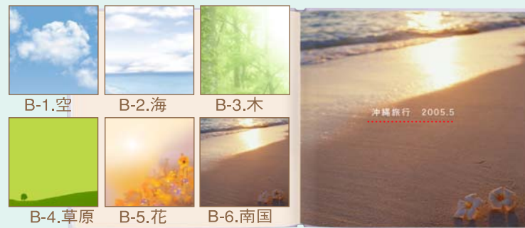
P1の背景イメージを6種類から選択できます。