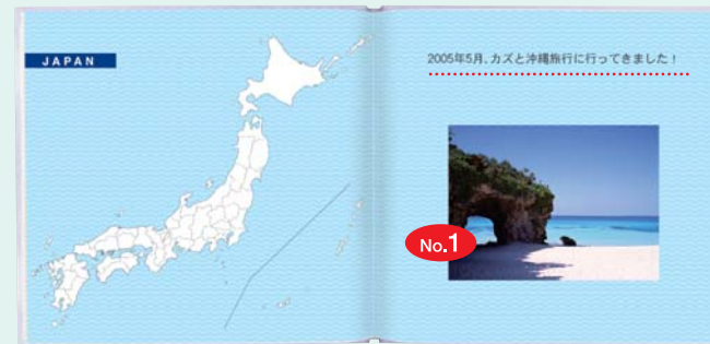
P2地図は選択された地域になります