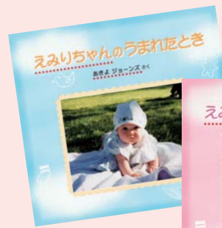
表紙 / ブルー ピンク

パパとママの出会いから始まり、お腹のエコー写真 生まれた時の様子、名前の由来、ご両親からの メッセージで綴るストーリー。新しい家族を迎えた感動を いつまでも大切に残せる一冊です。